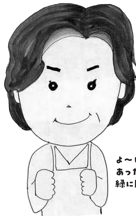
よ〜し あったかい家で 緑に囲まれて...

と・・・言いたいよ。 ・古い家は断熱改修で暖かくなりますか? ・費用はどのくらいかかるのかしら ・懐が寒くなったのでは意味がないし ・部分断熱できるのかしら? ・期間はどのくらいかかるの? 疑問がいつぱい出てきた よ〜し 腰の重い 主人を引っ張り出して 国実さんの 断熱リフォーム相談会に行へ〜