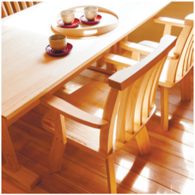
夢ハウス提供の無垢の家具 シンプルライフはお金のかけ方にメリハリをつける事が大切

シンプルに暮らして逆に鮮やか? 体が色とりどりの野菜を欲するように 暮らしにもいいものを取り入れれば より元気になれるはず。 豪華とか奇抜とか、かっこいいとかではなくて 自分の暮らしのリズムにあったものを。 住まう事も 食べることも 語らう事も くつろぐことも 音楽聞くことも...。 暮らしの中に取り入れたい 色とりどりのビタミン それはきつとシンプルライフの始まり。 軽やかな生活のリズムを 刻むために さあ! 春だ! 暮らしをリフォームしよう! (立)