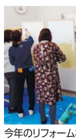
今年のリフォーム相談会での左官教室の様子