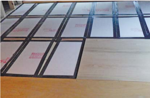
床断熱材敷き込み 気密テープでの隙間風対策